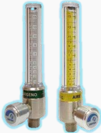
FLUJOMETRO PARA OXIGENO