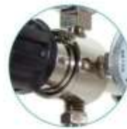
Regulación de presión a pistón