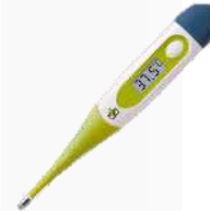
TERMOMETRO DIGITAL TERMOMETRO DIGITAL RIGIDO PARA USO PEDIATRICO Y ADULTO CON PANTALLA LCD PARA UNA FACIL Y RAPIDA LECTURA, SONIDO INDICATIVO CUANDO LA MEDICION DE LA TEMPERATURA HA FINALIZADO MEDICION DE LA TEMPERATURA CORPORAL EN TAN SOLO 60 SEGUNDOS