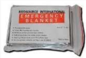
SABANA TERMICA PARA PROTECCION DE EMERGENCIA EN LAS CONDICIONES DE TODO CLIMA