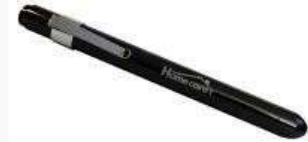
LAMPARA DE LED LÁMPARA PRACTICA Y LIGERA DE LARGA DURACIÓN EXCELENTE CALIDAD DE VISIÓN FOCO LED DE LUZ BLANCA ANTI-CAÍDAS ALTAMENTE RESISTENTE BATERÍAS DE ALTA DURABILIDAD PINZA DE METAL PARA FIJAR EN EL BOLSILLO